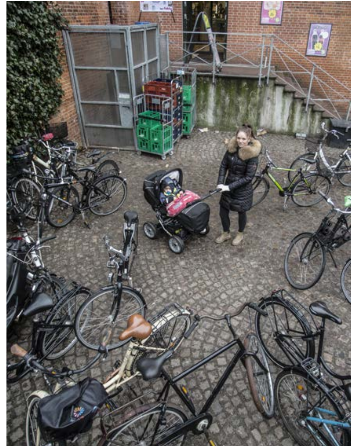
Cykler, der er parkeret uhensigtsmæssigt skaber rod i byrummet og kan være en stor udfordring for tilgængeligheden

Tilgængelighedsplanen indeholder også en handlingsplan for årene 2016 til 2019.