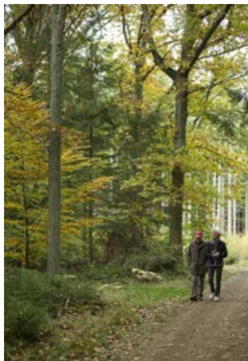
Gående i Hellebæk Skov

Tilgængelighed i naturen er ikke et område, der har været fokuseret på i den tidligere tilgængelighedsplan. Derfor er der i Helsingør Kommune heller ikke lavet registreringer over hvor i naturområderne, der er arbejdet med tilgængelighed ej heller hvilke udfordringer, der er størst. Danske Handicaporganisationer har ud-