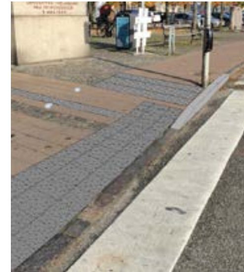
Forslag til ombygning af lyskryds ved Helsingør station. Forslag udarbejdet af ViaTrafik