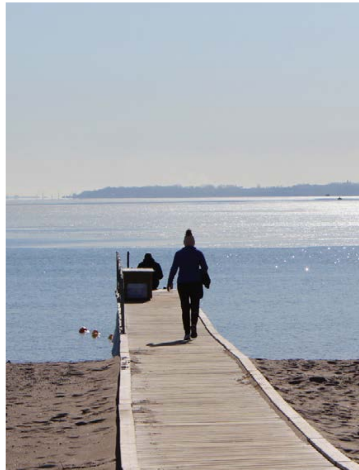
Strandfortov ved Espergærde Strand giver alle mulighed for at komme helt ud til vandet