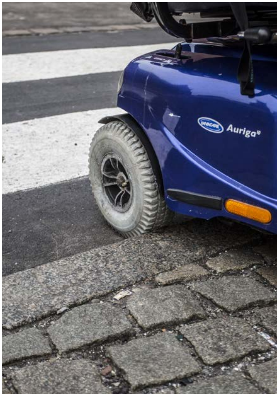
Kantstene skaber barrierer for nogle, men for blinde og svagtseende er det en fordel, da det skaber en mærkbar overgang