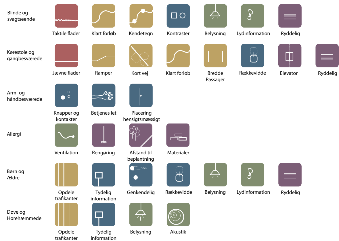
Diagram der viser hvad der er vigtigt at være opmærksom på i arbejdet med tilgængelighed. Udarbejdet af Helsingør Kommune som input til tilgængelighedsfolder