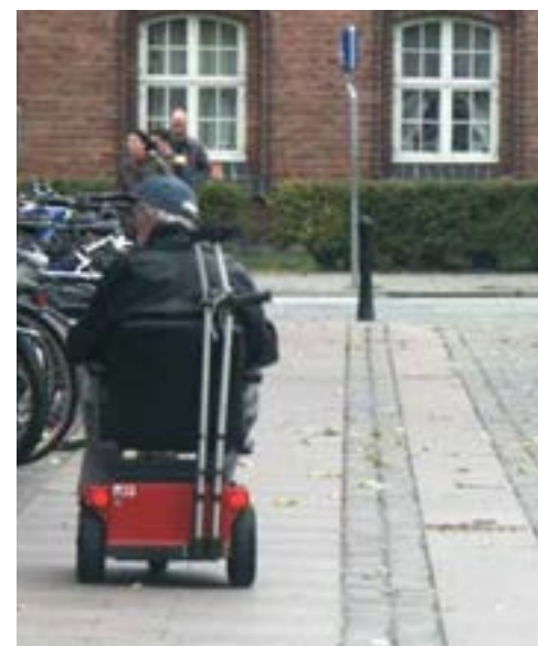
Jævne, plane gangbaner med tilstrækkelig bredde og afstand til hindringer sikrer tilgængelighed for alle. Fra Færdselsarealer for alle – Håndbog i Tilgængelighed

Tilgængelighed skal tænkes ind når Helsingør Kommune udarbejder lokalplaner og udskriver arkitektkonkurrencer og når Helsingør Kommune er byggherre. Hvis tilgængelighed først skal tænkes ind når en lokalplan er lavet eller arkitektforslaget udpeget, så er der en risiko for at nogle af de foreslåede løsninger giver en dårlig tilgængelighed.