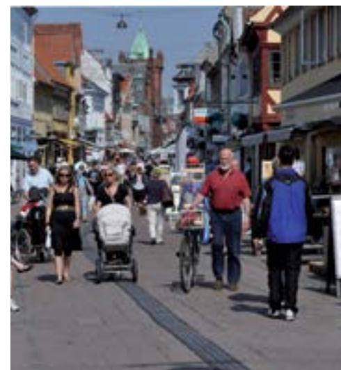
Ledelinje på Stengade i Helsingør

ringer over hvilke punkter fra handlingsplanen 2009, der er efterlevet og hvilke, der ikke er. I registreringen vises, hvor der er ujævne belægninger, mangler ramper, eller mangler opmærksomhedsfelter og ledelinjer.