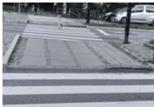
Korrekt udformet helle. Kantstensopspring på 6 cm ved retningsfeltet og nedsænket kantsten og asfaltrampe med "0-kant" på resten af hellen.