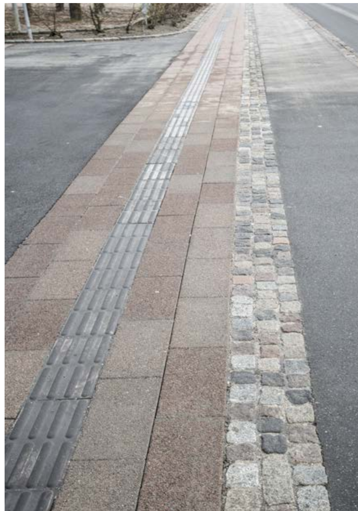
God og tydelig opdeling af trafikanter, her også med ledelinje til blinde og svagtseende. Eksemplet er fra Havnegade i Helsingør.