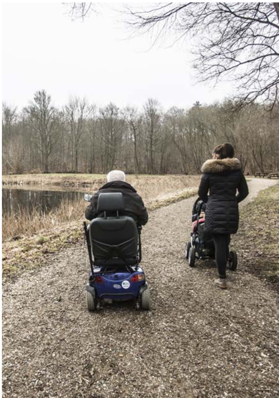
Faste skovstier giver mulighed for, at alle kan bevæge sig ud i naturen