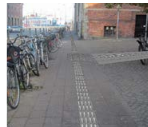
Forslag til ledelinje og opmærksomhedsfelt ved Helsingør station. Forslag udarbejdet af ViaTrafik