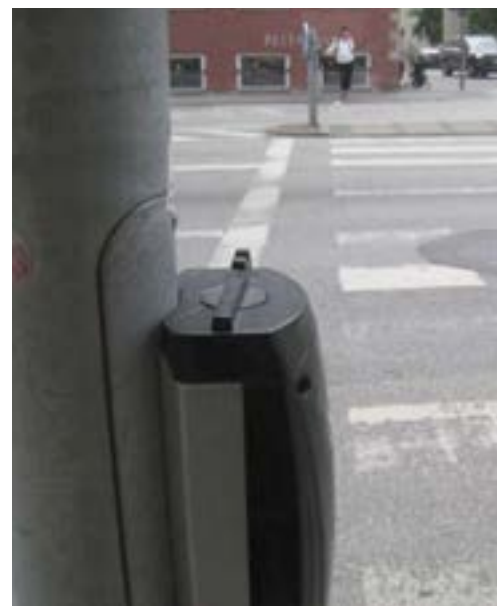
Lydfyr der giver lydsignaler. Her med retningsgiver for svagtseende og blinde

Helsingør Kommune stiller krav og ønsker til tilgængelighed i nye anlægsprojekter . Dette gøres ved, tidligt i processen, at formidle kommunens prioriteringer til rådgivere og ved at stille krav om tilgængelighedsrevision til anlægsprojektet.