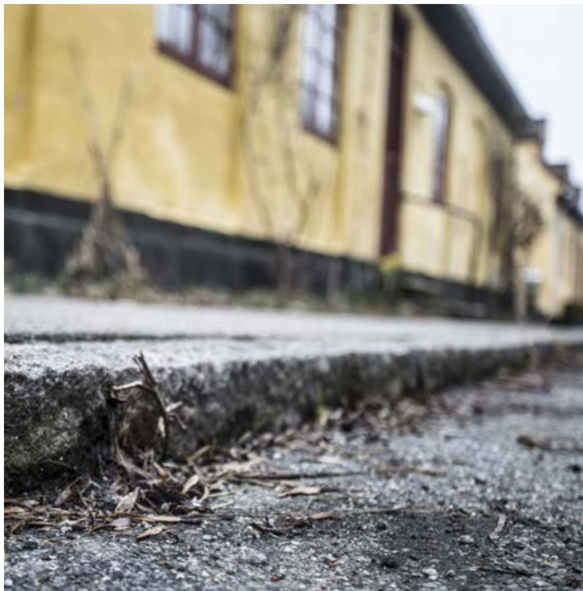
Høj kantsten i Bøssebogsgade i Hellebæk