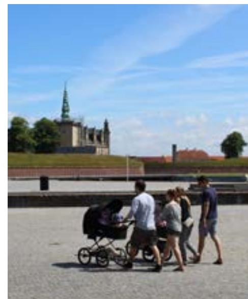
Familie med barnevogn ved Kulturværftet