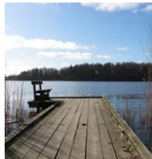
Tilgængelig bro i Edens have. Her er der handicapvenlige adgangs- og toiletforhold

trykt et særligt ønske om tilgængelighed til strand i form af strandfortov eller handicapvenlig badebro, så alle kan komme helt ud i vandet. Herudover har Helsingør Kommune haft dialog med følgegruppen for tilgængelighedsplanen, der har ønsket tilgængelighedsruter i skovområder, særligt med henblik på blinde og svagtseende.