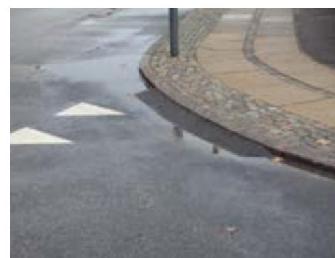
Ramper er til gavn for den ældre med rollator, mødre med barnevogne, kørerstolsbrugere osv.

Helsingør Kommune fortsætter med at etablere nedsænkede kanstene og asfaltramper mellem fortov, stier og veje , der hvor det er hensigtsmæssigt. Eksempelvis ved busstoppesteder, fra fortov til cykelsti og ved fodgængerovergange. Ved uregulerede krydsninger etableres nedsænkede kantsten i begge sider.