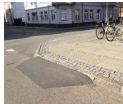
For dyb asfaltrampe. Asfaltrampen er udført med hældning 1:10, men den høje kantsten medfører at rampen går for langt ud i kørebanelen, hvilket medfører at cyklister og elscootere risikerer at vælte når de kører på langs af rampen. En asfaltrampe må maks. gå 30 cm ud i cykelsti/kørebane. Kan dette ikke opnås pga. for højt kantsten, må kantstenen sænkes.