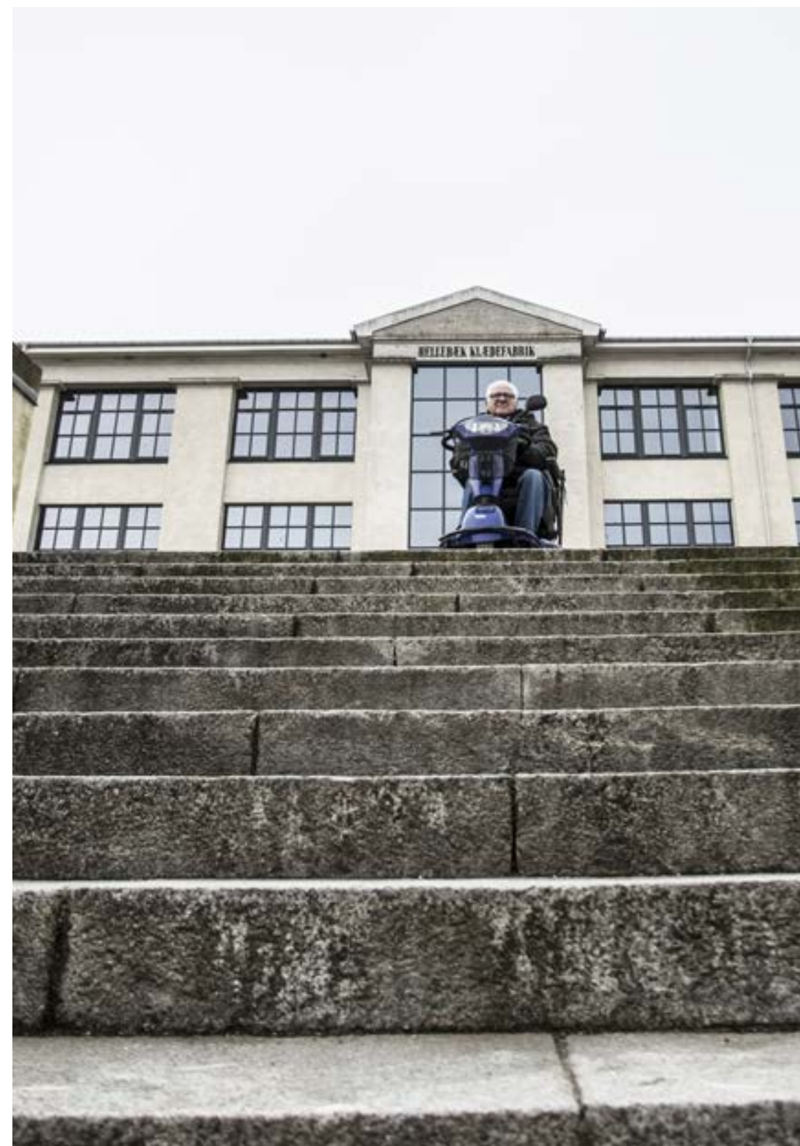
Ikke alle steder er lige tilgængelige. Ved Hellebæk klædefabrik er der heldigvis ikke kun trappeadgang.