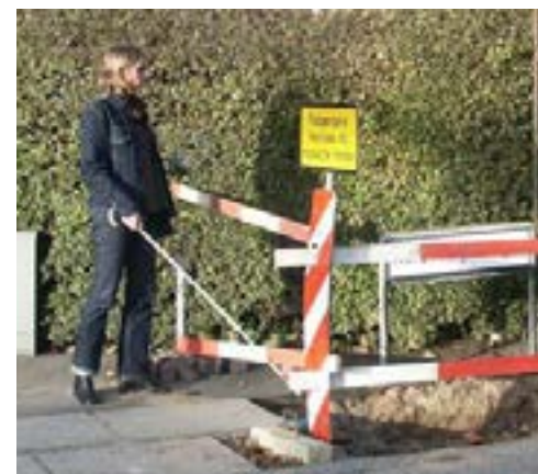
Gravearbejde der er afmærket vha. bomme. Bommene er opstillet for tæt på udgravningen. Fra Færdselsarealer for alle – Håndbog i Tilgængelighed

Dialoggruppen består af repræsentanter fra Danske Handicaporganisationer, Ældrerådet, Dansk Fodgænger Forbund og Center for Teknik, Miljø og Klima. Dialoggruppen drøfter de tilgængelighedstiltag og løsningsmuligheder, som Helsingør Kommune planlægger at etablere ud fra de midler der er afsat. I Dialoggruppen er der mulighed for, at komme med forslag til supplerende anlægsønsker om tilgængelighed, der kan indgå i budgetforhandlingerne i efteråret.