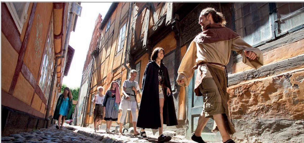
Fællesskaber for børn og unge i Helsingør Kommune kommer til udtryk på mange måder

Vi vil sikre de bedste rammer for børn og unges deltagelse i alle relevante fællesskaber, og vi vil arbejde for at udvikle meningsfulde fællesskaber